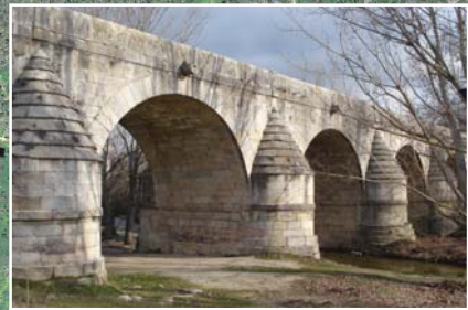
2 Puente del Retamar