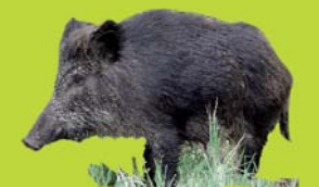
Jabalí ( Sus scrofa )