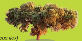
Encina ( Quercus ilex )