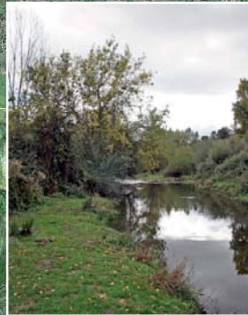
1 Río Guadarrama