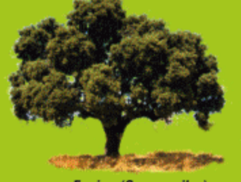
Encina ( Quercus ilex )