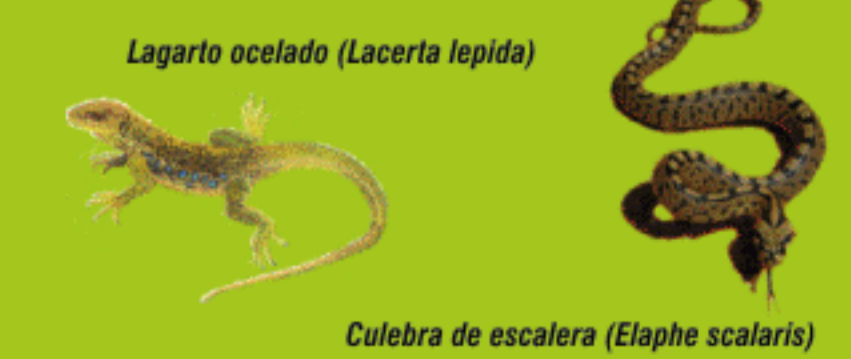
Culebra de escalera ( Elaphe scalaris )